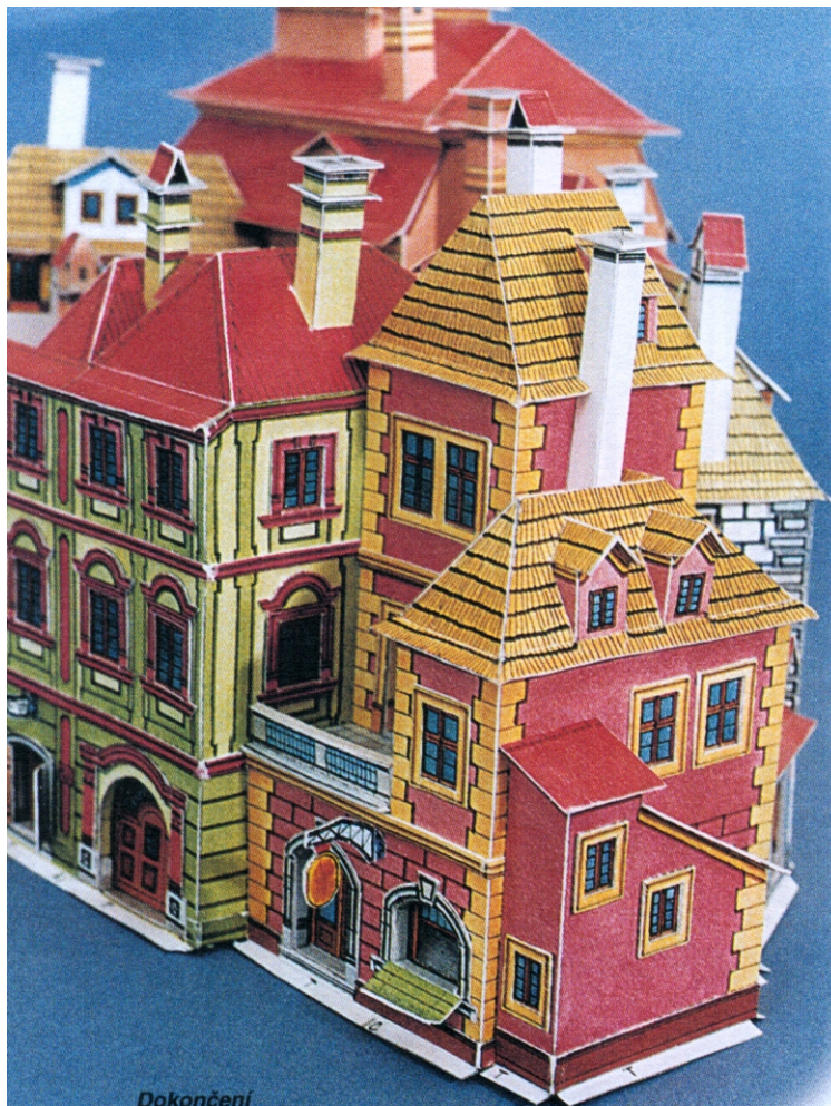
Dokončení ze strany d1

Zpracujete díly 76, 77, osadíte je na díl 72 a hotový přístavek připojíte k celku, tj. na díl 61. Zkompletujete madlo zábradlí 84, přilepíte je - natupo - na zpracované zábradlí terasy 83 a to osadíte na terasu 82 a přilepíte k dílu 62. Zkompletovaný prodejní pult 116 přilepíte do výkladce na díl 115 a zpracovaný vývěsní štít 117 přilepíte nad vchod do krámu, tj. na díl 61. Díl 80 přilepíte podle návodné kresby na vyznačené místo na dílu 61. Dům je hotov a doporučujeme opět, abyste jej nechali pod zátěží dokonale proschnout.