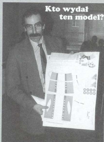
Kto wydał ten model?

UWAGA: do regulaminu Zawodów został wprowadzony dodatkowy konkurs: Na najlepiej wykonany model polskiego samolotu TS-8 Bies (wydawnictwa GPM). Nagrody w tym konkursie fundowane są przez wydawcę i organizatora imprezy.